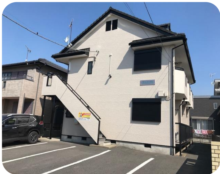
高速バス鹿島～東京駅線 「鹿島セントラルホテル」下車 400m