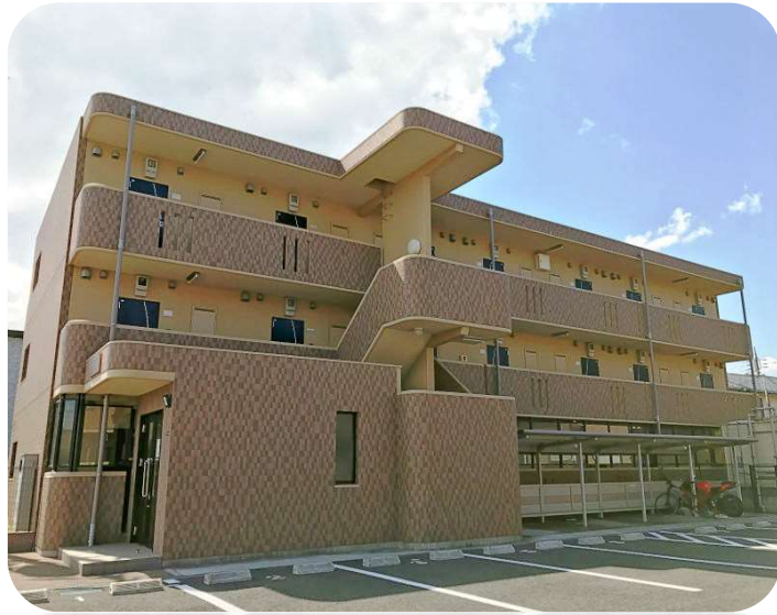
高速バス鹿島～東京駅線 「鹿島セントラルホテル」下車 約1400m