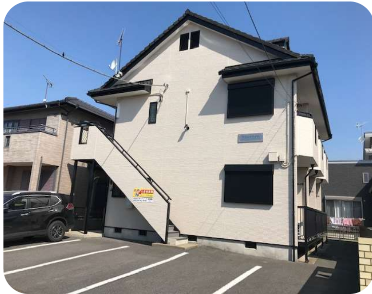
高速バス鹿島～東京駅線 「鹿島セントラルホテル」下車 400m